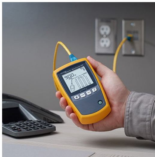
Рисунок 5. The MicroScanner PoE is Ethernet Alliance Gen2 PoE certified and can detect the power offered by the PSE plus the network's speed, and features a suite of cable testing features.

Выберите правильное оборудование, организуйте сертификацию кабеля, снабдите своего технического специалиста необходимым инструментом для проверки и поиска неисправностей вашей кабельной системы, и ваш проект PoE будет выполнен безупречно.