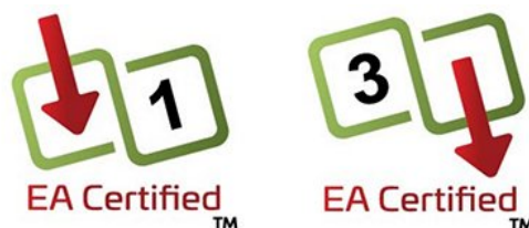
Рисунок 3. Стикеры Ethernet Alliance для питаемых устройств (PD) (слева) и устройств-источников электропитания (PSE) (справа).

Проектировщикам или монтажникам оборудования PoE будет достаточно взглянуть на эти стикеры на устройствах PSE и PD, чтобы удостовериться в их совместимости. Если номинал PSE соответствует требованиям PD или превышает их, функциональная совместимость гарантирована.